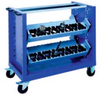
Abb. /Réf.5 NC-Wagen mit 32 Werkzeugaufnahmen Chariot 32 outils