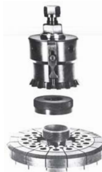
Plate type "Standard", cone, nut and key

Plateau type "standard", cône, écrou et clé de démontage