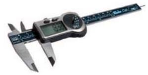
TWIN CAL IP67