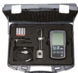
TESA myFinder Set 22