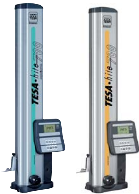
Magna 700 TESA-HITE 700

CHF173.40 reticle (replacement part) CHF 76.30