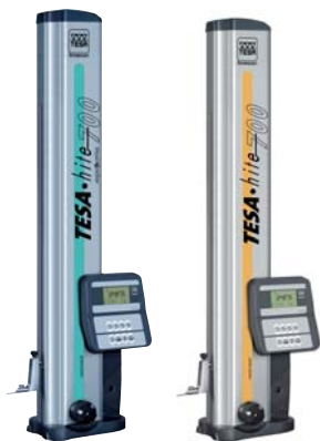
Magna 700 TESA-HITE 700