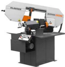
ACTRON 265 DG