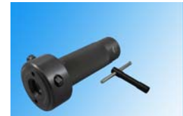
Dorn / arbre / arbor

Tool holder system for drilling & tapping on lathes